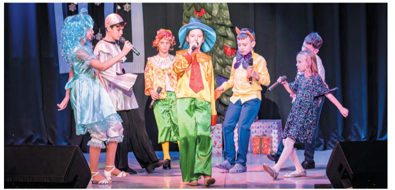
«Где водятся волшебники» – песня Незнайки